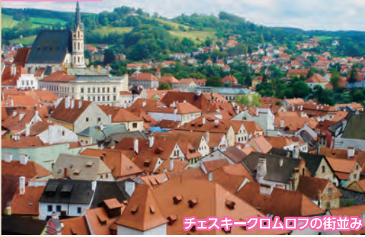
チェスキー・クロムロフの街並み