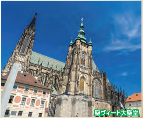
聖ヴィート大聖堂

※お申し込みの際には、必ず旅行条件書(全文)をお受け取りいただき、事前にご確認の上お申し込みください。