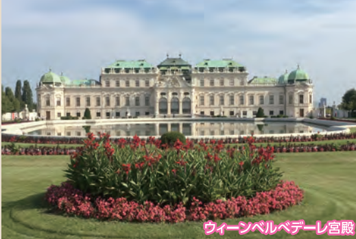
ウィーン・ベルベデーレ宮殿