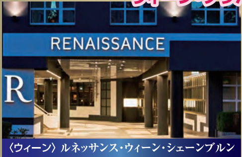
〈ウィーン〉ルネッサンス・ウィーン・シェンブルン