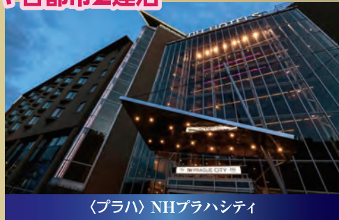
〈プラハ〉NHブラハシティ