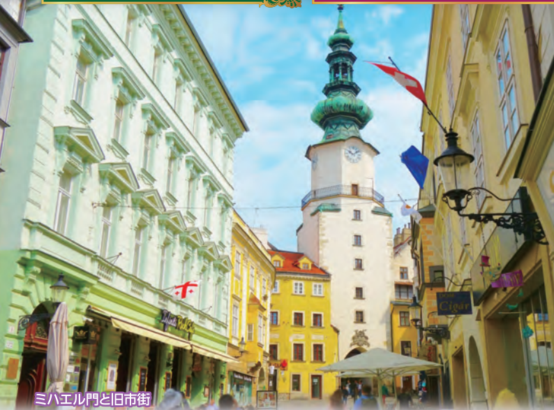
ミハエル門と旧市街