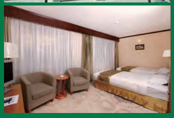
上/ホテル外観、下/お部屋一例

※お申し込みの際には、必ず旅行条件書(全文)をお受け取りいただき、事前にご確認の上お申し込みください。