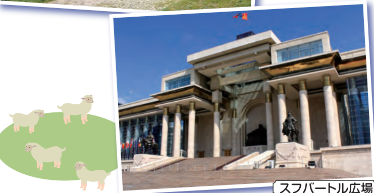
スフバートル広場